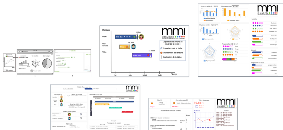
Exemples de TBA